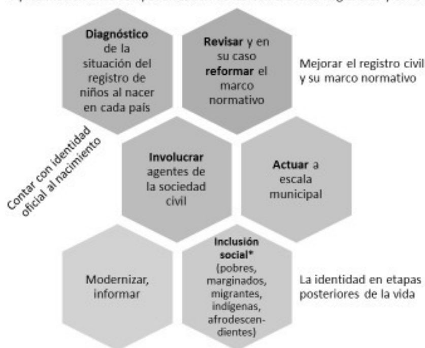
Esquema 2. Desarrollo conceptual y estrategias para mejorar el registro civil. Aproximación en la compatibilización de las Conferencias Regionales y el PUICA

(12) Secretaría de Gobernación, Diario Oficial de la Federación , 17 de junio de 2014.