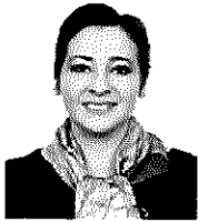
Dip. Fed. Angélica Reyes Ávila