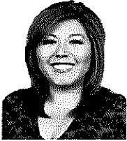
Dip. Fed. Genoveva Huerta Villegas