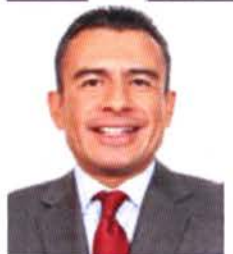
Dip. Fidel Calderón Torreblanca