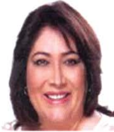
Dip. Nelly del Carmen Márquez Zapata