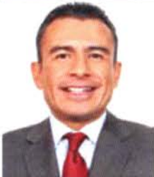
Dip. Fidel Calderón Torreblanca