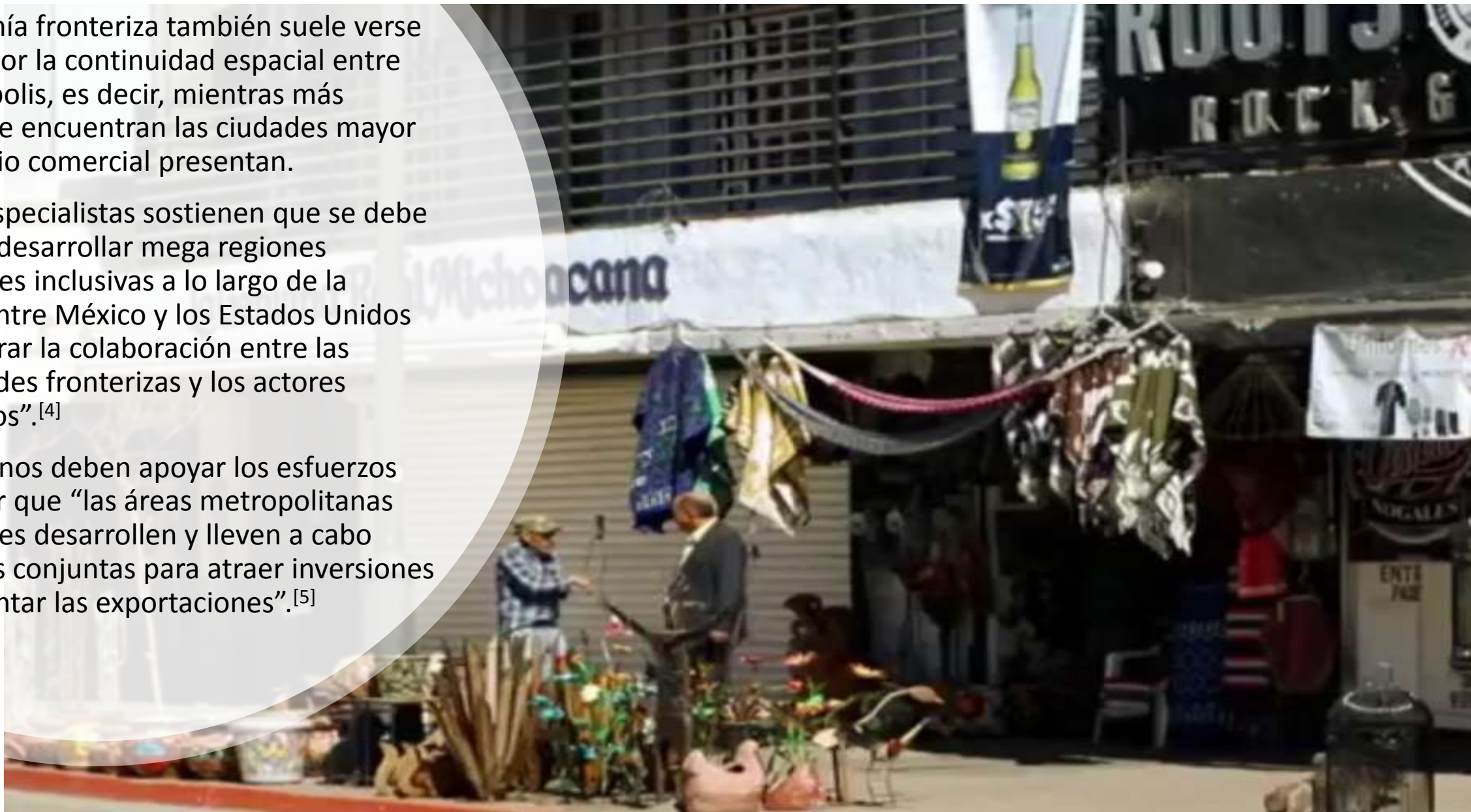
25 julio, 2018