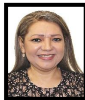
DIP. MARÍA DEL ROSARIO GUZMÁN AVILÉS INTEGRANTE (PAN)