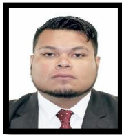
DIP. PEDRO DANIEL ABASOLO SÁNCHEZ INTEGRANTE (MORENA)