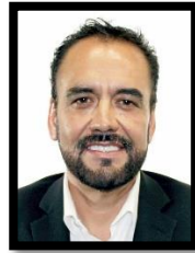
DIP. JUAN CARLOS LOERA DE LA ROSA INTEGRANTE (MORENA)