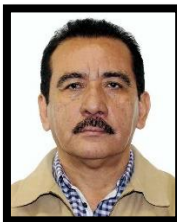
DIP. RODRIGO CALDERÓN SALAS INTEGRANTE (MORENA)