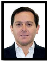
DIP. PEDRO PABLO TREVIÑO VILLARREAL INTEGRANTE (PRI)