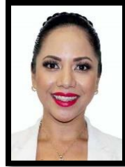
DIP. JUANITA GUERRA MENA (MORENA) PRESIDENTA