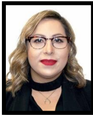
DIP. LIZBETH MATA LOZANO INTEGRANTE (PAN)