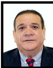
DIP. ALFREDO PORRAS DOMÍNGUEZ INTEGRANTE (PT)