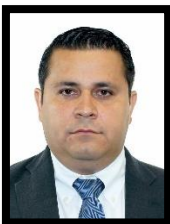
DIP. ARMANDO TEJEDA CID INTEGRANTE (PAN)