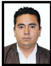
DIP. DAVID ORIHUELA NAVA INTEGRANTE (MORENA)