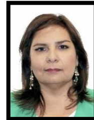
DIP. BEATRIZ MANRIQUE GUEVARA INTEGRANTE (PVEM)