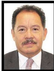
DIP. MOISÉS IGNACIO MIER VELAZCO INTEGRANTE (MORENA)