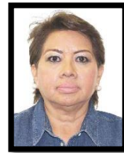
DIP. MA. GUADALUPE ALMAGUER PARDO INTEGRANTE (PRD)