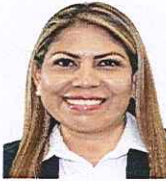
16.- Dip. Carmina Yadira Regalado Mardueño