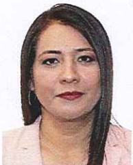
30.- Dip. Claudia Reyes Montiel. (PRD) México