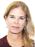
Dip. María Marcela Torres Peimbert Secretaria