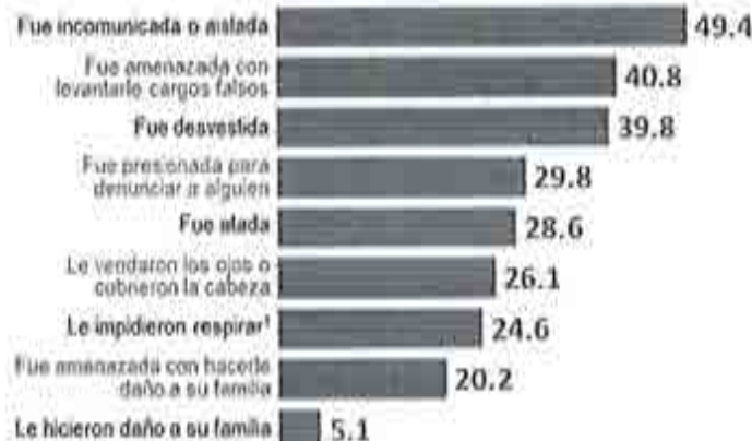
Situaciones de violencia psicológica durante la etapa de presentación ante el Ministerio Público identificadas por la población privada de la libertad, 2016

Ahora bien, ya en la etapa del cumplimiento de la prisión preventiva como medida cautelar, debe resaltarse que el 45.6% de las personas privadas de la libertad compartieron la celda con más de cinco personas, lo cual refleja un alto estado de concentración en la población penitenciaria. Finalmente, como un dato trascendente para los fines del presente Dictamen, esta Comisión advierte que sólo el 44.6% de la población privada de la libertad a nivel nacional identificó algún tipo de separación por parte del Centro Penitenciario entre los internos que cuentan con sentencia dictada y aquellos que se encuentran en proceso de obtenerla.