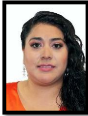
DIP. ESMERALDA DE LOS ÁNGELES MORENO MEDINA SECRETARIA (PES)