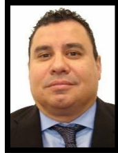
DIP. FRANCISCO JORGE VILLARREAL PASARET INTEGRANTE (MORENA)