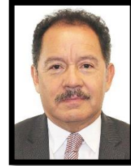
DIP. MOISÉS IGNACIO MIER VELAZCO INTEGRANTE (MORENA)