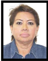
DIP. MA. GUADALUPE ALMAGUER PARDO INTEGRANTE (PRD)