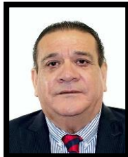
DIP. ALFREDO PORRAS DOMÍNGUEZ INTEGRANTE (PT)