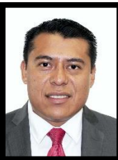
DIP. RUBÉN TERÁN ÁGUILA INTEGRANTE (MORENA)