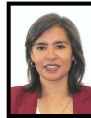
DIP. MARÍA WENDY BRICEÑO ZULOAGA INTEGRANTE (MORENA)