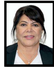
DIP. CARMEN MORA GARCÍA INTEGRANTE (MORENA)