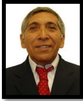
DIP. LIMBERT IVÁN DE JESÚS INTERIAN GALLEGOS INTEGRANTE (MORENA)