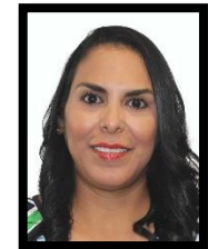
DIP. MIRTHA ILIANA VILLALVAZO AMAYA INTEGRANTE (MORENA)