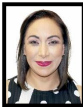
DIP. ADRIANA DÁVILA FERNÁNDEZ SECRETARIA (PAN)