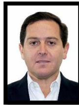
DIP. PEDRO PABLO TREVIÑO VILLARREAL INTEGRANTE (PRI)