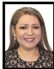
DIP. MARÍA DEL ROSARIO GUZMÁN AVILÉS INTEGRANTE (PAN)