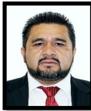
DIP. GUSTAVO CONTRERAS MONTES INTEGRANTE (MORENA)