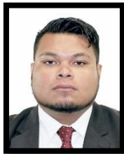
DIP. PEDRO DANIEL ABASOLO SÁNCHEZ INTEGRANTE (MORENA)