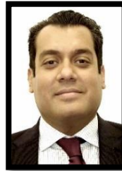
DIP. SERGIO CARLOS GUTIÉRREZ LUNA INTEGRANTE (MORENA)