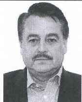
Dip. Alfredo Femat Bañuelos Presidente

En la Opinión sobre el Plan Nacional de Desarrollo 2019 – 2024 de la Comisión, fueron plasmadas veinte firmas en pro y una en contra. El día viernes 31 de mayo de 2019, fue entregada la Opinión, anexando todos los documentos que los diputados integrantes hicieron llegar a la Comisión de Relaciones Exteriores en torno a ella, en las oficinas de la Conferencia para la Dirección y Programación de los Trabajos Legislativos.