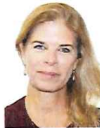
Dip. María Marcela Torres Peimbert Secretaria