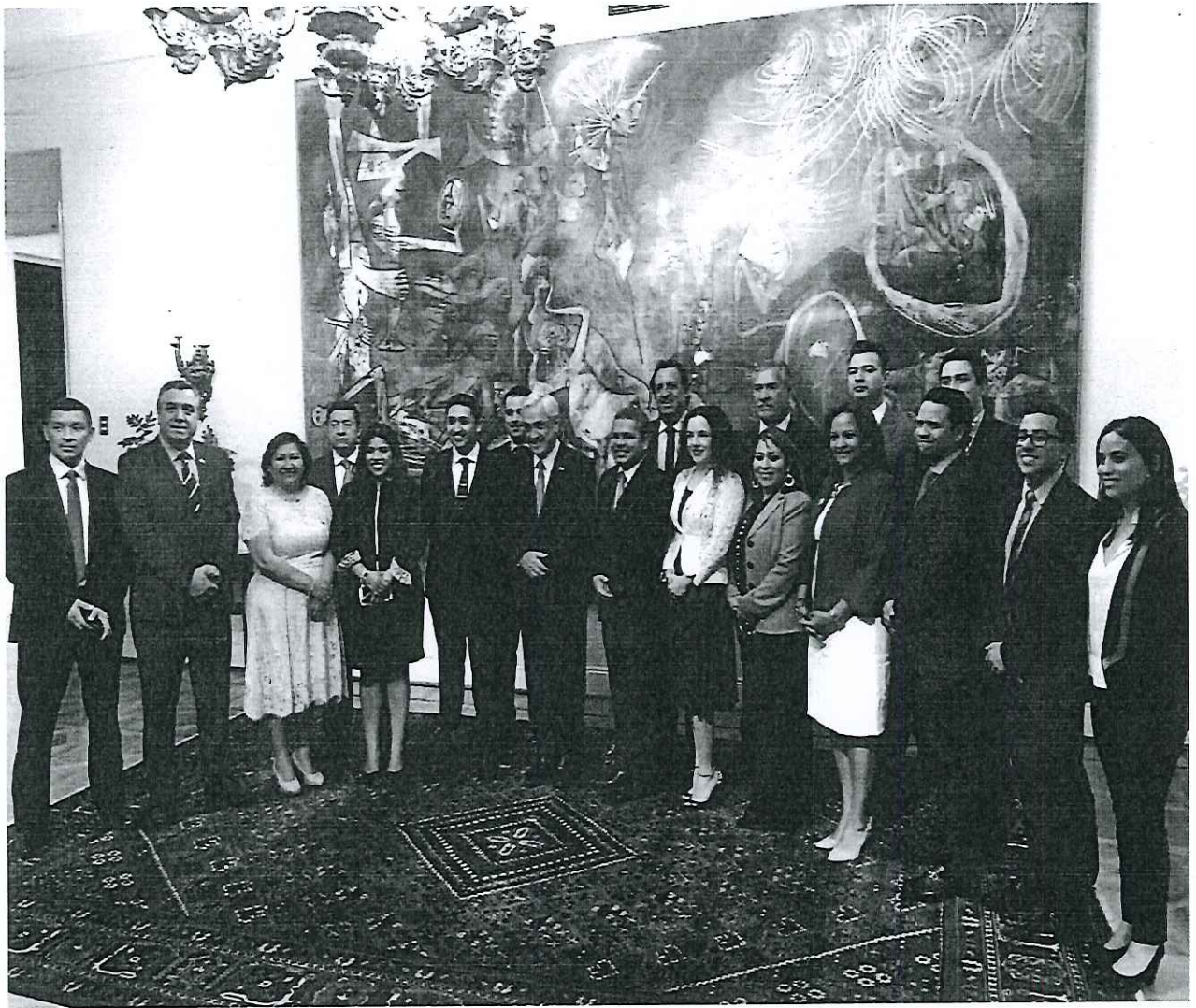
Encuentro con el Presidente de la República de Chile, Sebastián Piñera Echenique