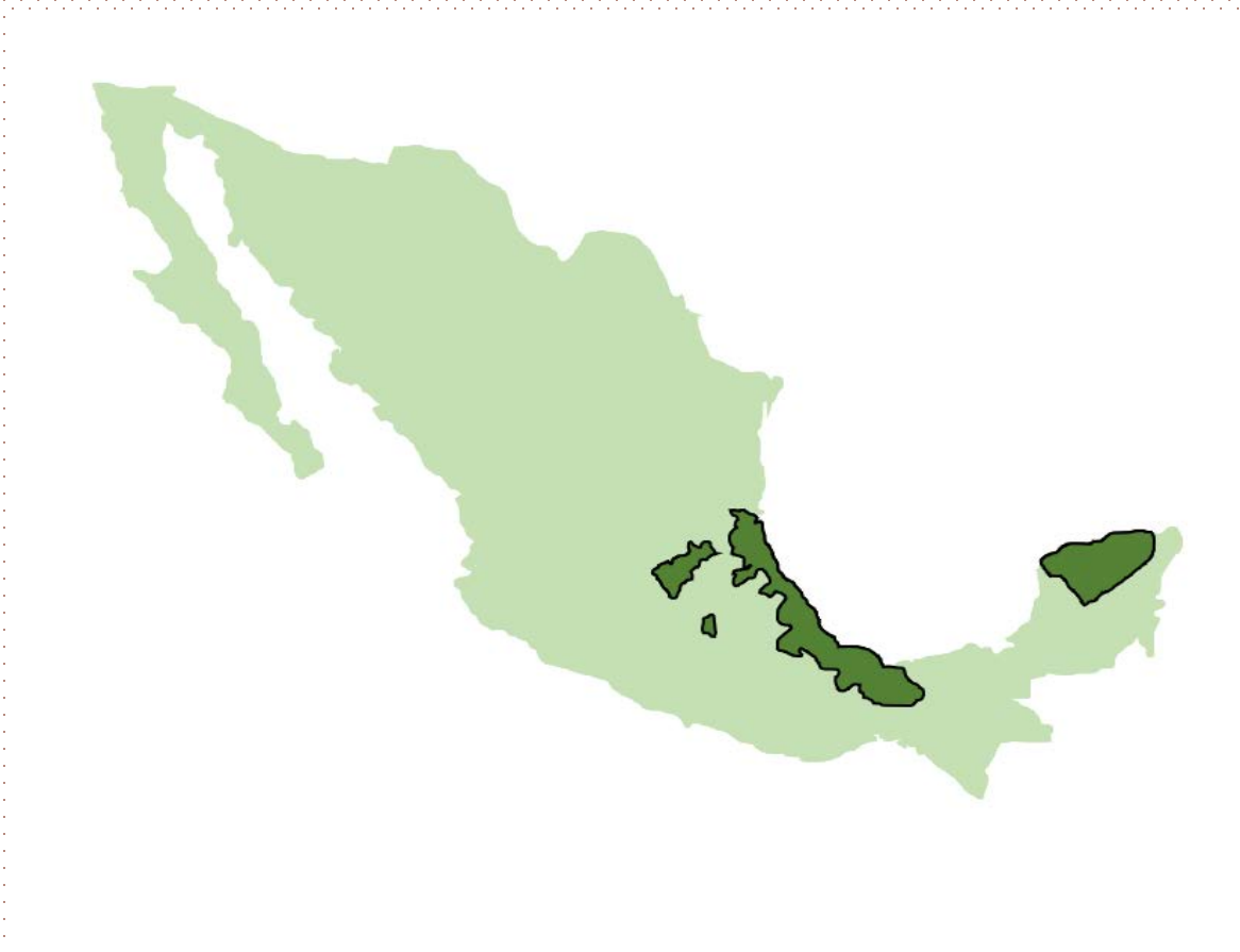
Mapa 1. Entidades pioneras en participación ciudadana