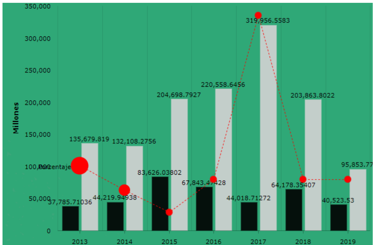
Gráfica 1. Montos en fideicomisos. Actualizados de la Cuenta Pública 2019