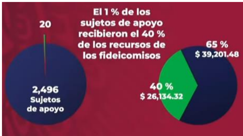
Gráfica 2. Inequidad, pulverización e ineficiencia 2000-2018

Fuente: Gobierno de México, Conferencia del miércoles 21 de octubre de 2020.