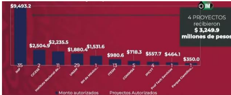
Gráfica 3. Fondos Sener-Conacyt. Hidrocarburos y sustentabilidad 2009-2020 Instituciones y empresas más beneficiadas

Fuente: Gobierno de México, Conferencia del miércoles 21 de octubre de 2020.