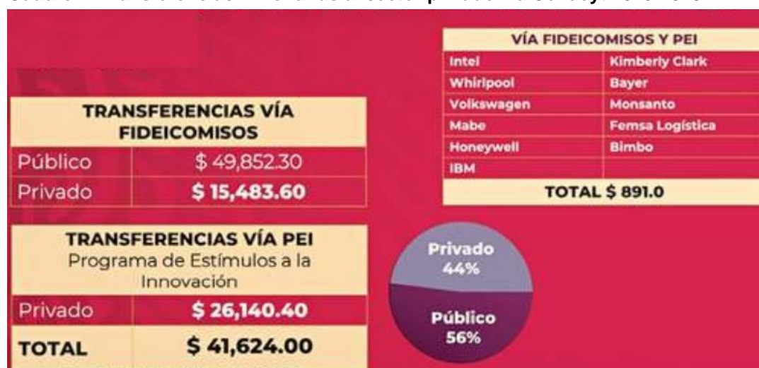
Cuadro 2. Transferencias millonarias al sector privado vía Conacyt 2013-2018

Fuente: Gobierno de México, Conferencia del miércoles 21 de octubre de 2020.