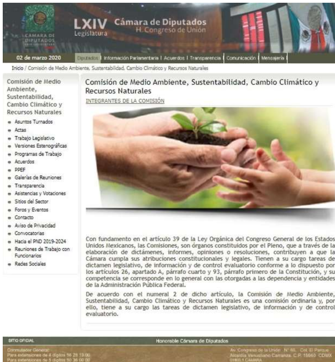
Figura 1. Aspecto de la página de inicio del micrositio de la Comisión.