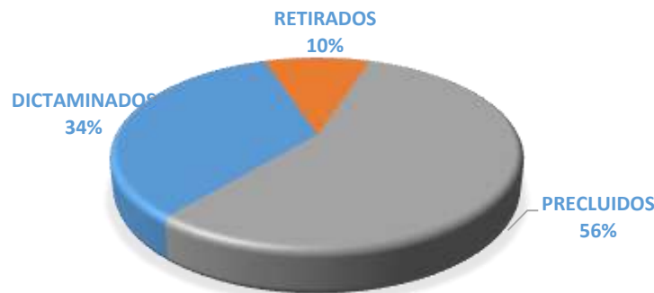
EXPEDIENTES CON PROCESO CONCLUIDO

Del total de los asuntos concluidos, 64 de ellos han sido dictaminados y 19 retirados a solicitud de los diputados proponentes. Por disposición reglamentaria se consideran asuntos concluidos 106 expedientes.