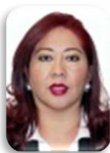
Dip. Guadalupe Ramos Sotelo MORENA