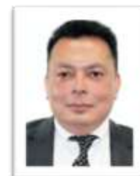
Dip. Ulises Murguía Soto MORENA