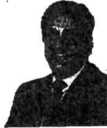
José Ignacio Echániz Salgado, Diputado por Guadalajara. G.P. Popular en el Congreso