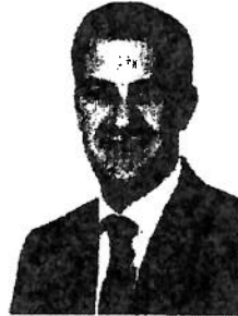
Miguel Ángel Castellón Rubio Diputado por Almería. G.P. Popular en el Congreso