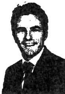
Pedro Casares Hontañón Diputado por Cantabria. G.P. Socialista