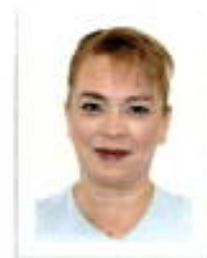
Dip. Lucía Flores Olivo MORENA