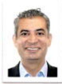
Dip. Enrique Ochoa Reza PRI