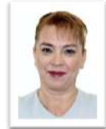
Dip. Lucía Flores Olivo MORENA