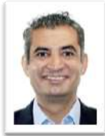
Dip. Enrique Ochoa Reza