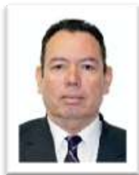
Dip. Manuel Baldenebro Arredondo