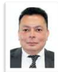
Dip. Ulises Murguía Soto MORENA