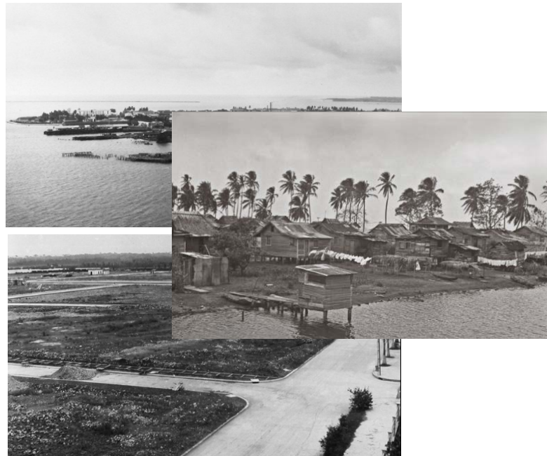
Colón, Panamá: Antes