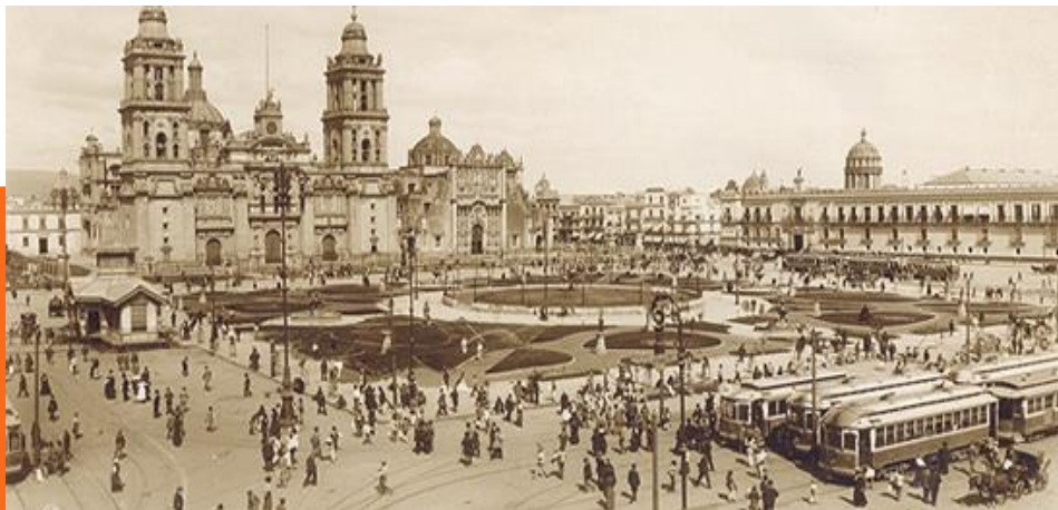
Zócalo principios del siglo XX