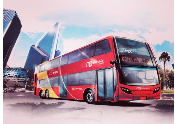
Tendencias de la modernización