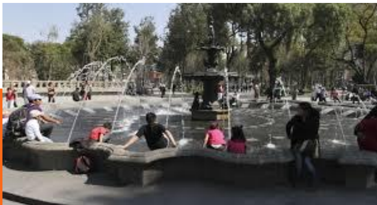
Fuente de la Alameda Central