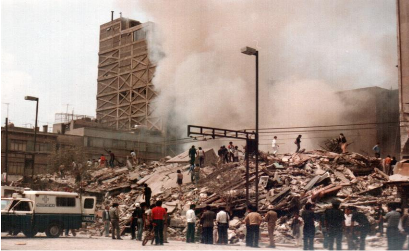
Terremotos de septiembre de 1985