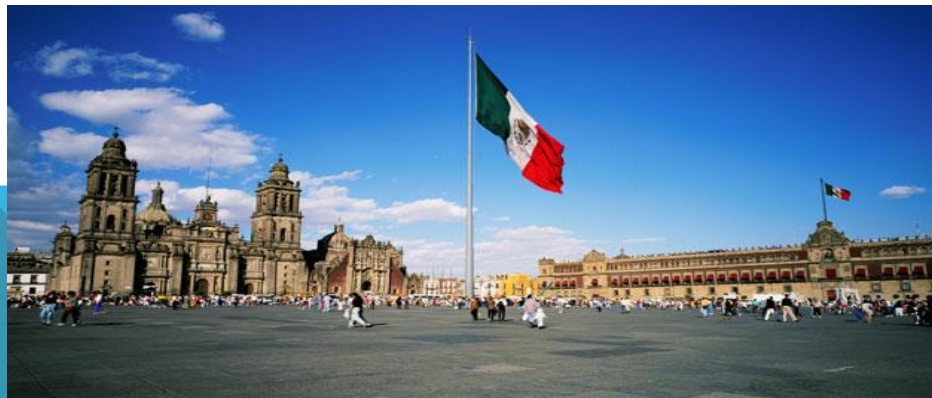
Zócalo, Asta Bandera, Catedral y Palacio Nacional