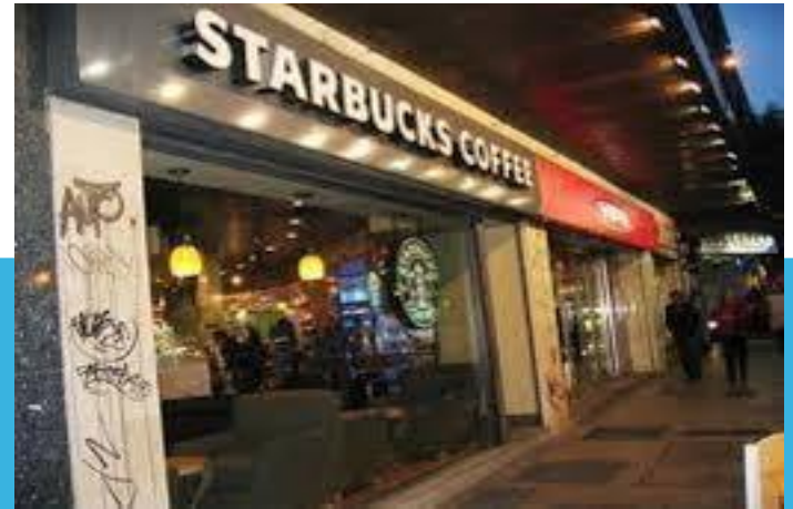
Invasión del espacio con franquicias mundiales