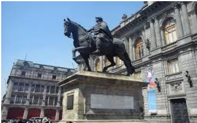
Estatua de El Caballito de Manuel Tolsá

“(....) el valor único de la auténtica obra artística se funda en el ritual en el que tuvo su primer y original valor útil. Dicha fundamentación estará todo lo mediada que se quiera, pero incluso en las formas más profanas del servicio a la belleza, resulta perceptible en cuanto ritual secularizado.” Walter Benjamin.