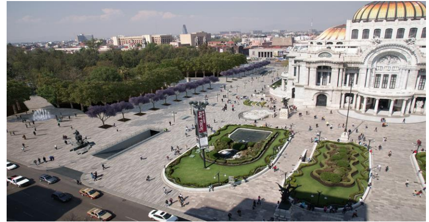
Alameda Central y Palacio de Bellas Artes