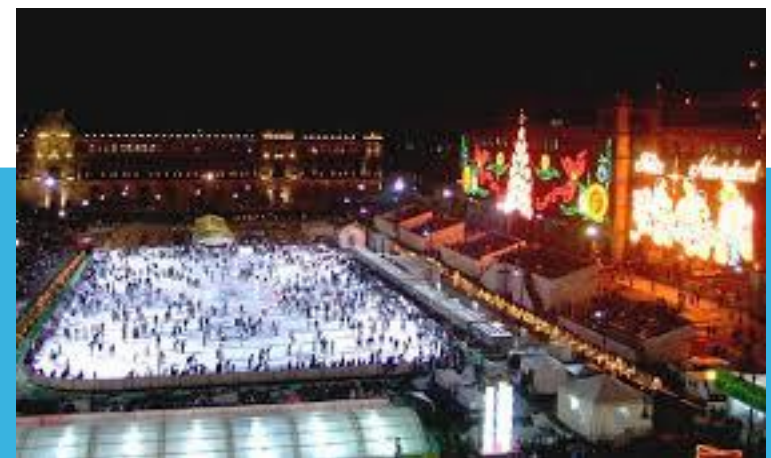
Pista de patinaje en el Zócalo