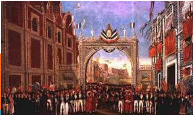
El Centro Histórico en la Independencia