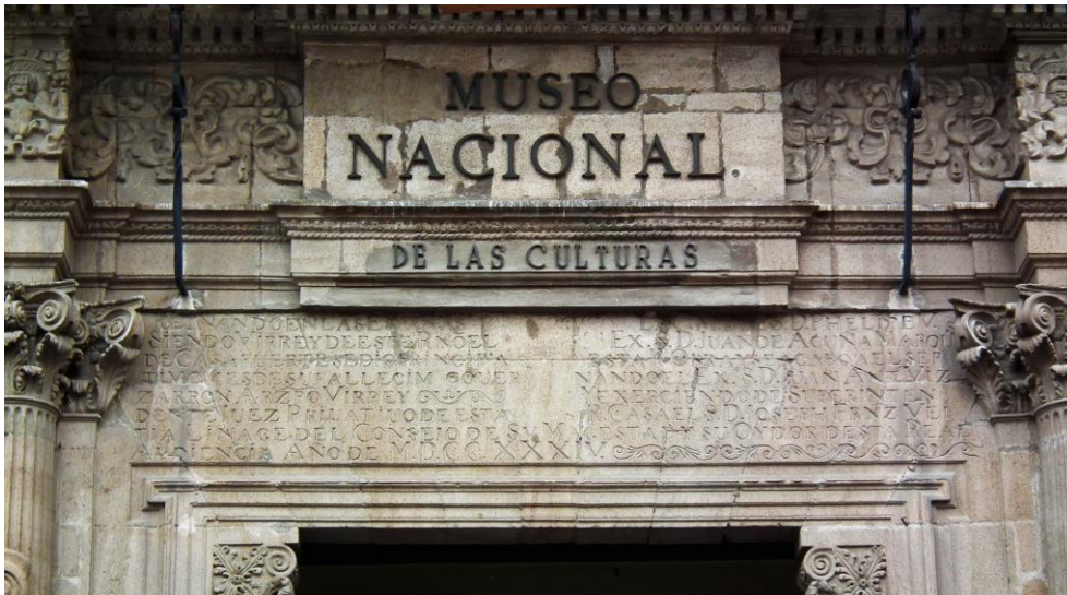
Museo Nacional de las Culturas