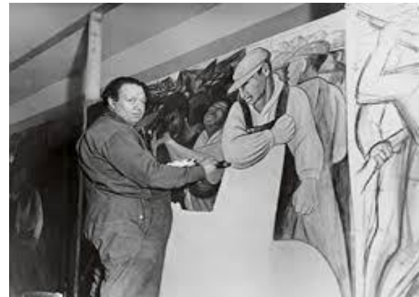
Diego Rivera en Palacio Nacional