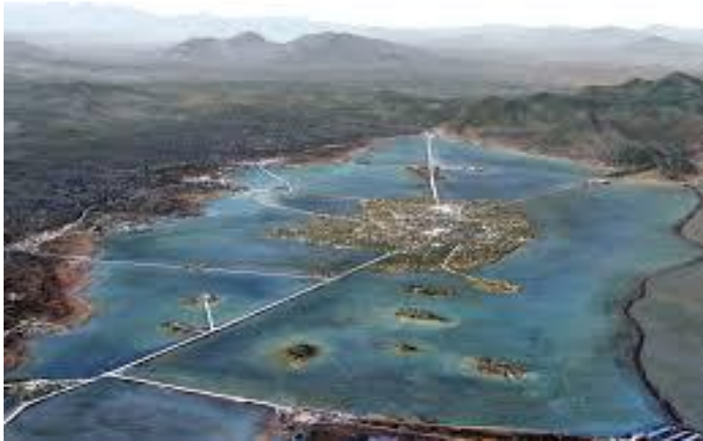
La isla de Tenochtitlan