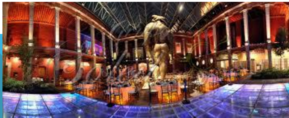
Museo José Luis Cuevas en el Centro Histórico