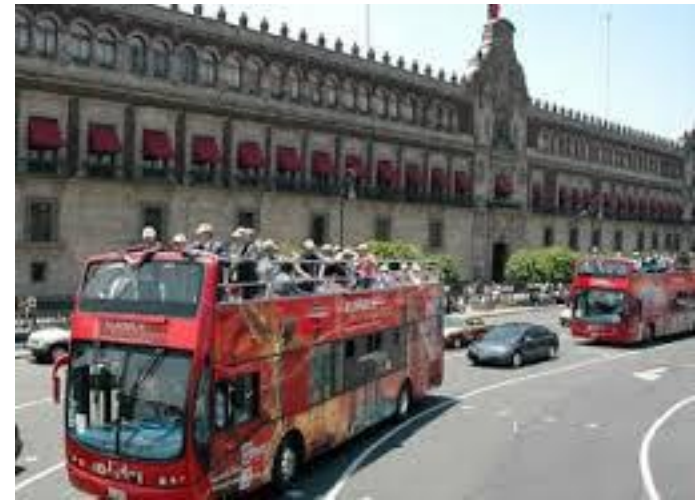
Turibús en el Zócalo