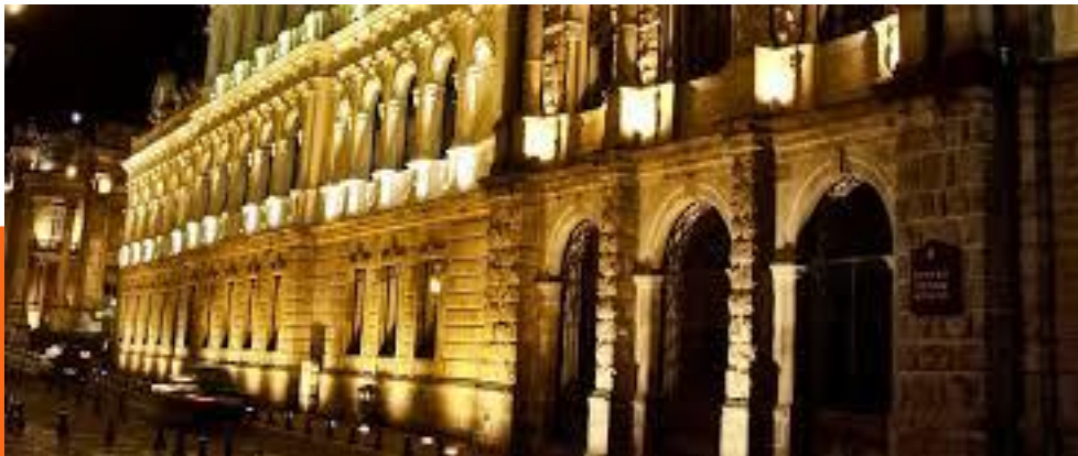
Hotel de la Ciudad de México