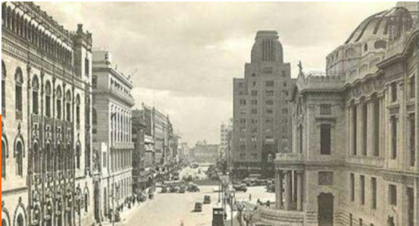
La llegada del automóvil y nuevos edificios