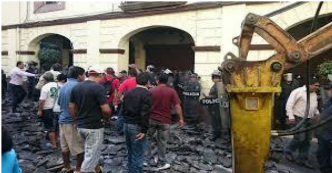
Cambio de pisos en calles

Los soportes materiales de los aparatos de Estado capitalista demandan una renovación que implica destrucción masiva para acumular sobre nuevas bases creando una nueva centralidad. Los centros históricos aparecen como un producto histórico acumulativo de la concentración y centralización de un lugar de la ciudad con múltiples elementos de vida social y soportes materiales específicos. Emilio Pradilla Cobos (1984)