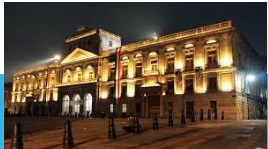
Palacio de Minería