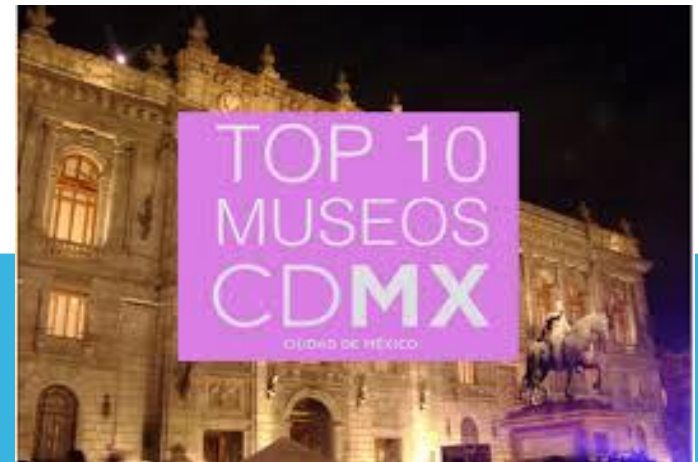
Museo de la Ciudad de México