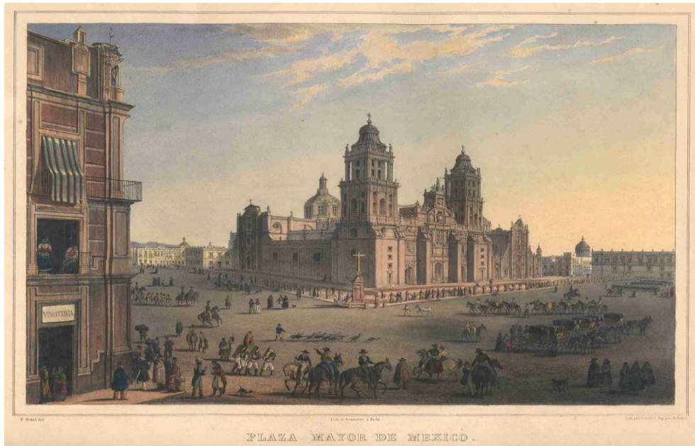
Zócalo del siglo XVIII

“Cada sociedad produce su espacio (...) los lugares se yuxtaponen solamente en el espacio social, en contraste con lo que sucede en el espacio naturaleza; se intercalan se superponen y a veces colisionan”.