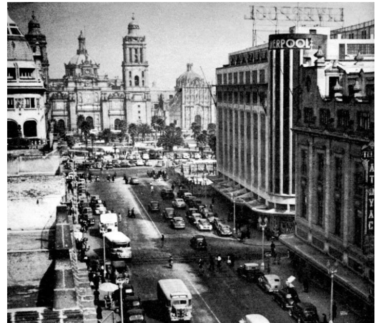
Avenida 20 de Noviembre