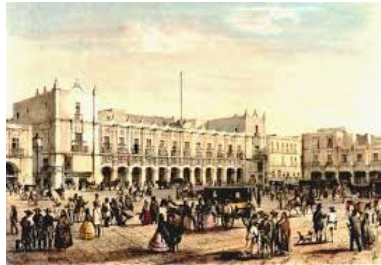
El Zócalo en la Colonia