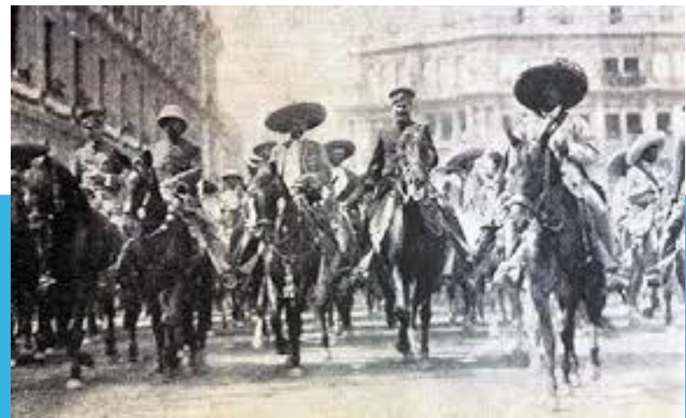
Emiliano Zapata llegando al Centro Histórico