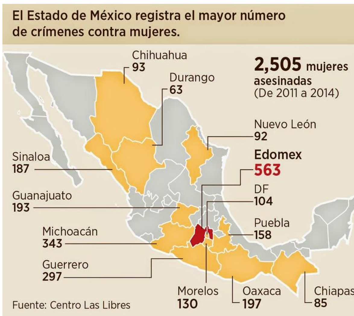
Mapa 2. Femicidios en México 2011-2014

Fuente: El Diario de la Tercera Edad (24 de noviembre de 2011). “El feminicidio está presente en todo el país; ni leyes ni el gobierno lo han podido detener”. En línea [ http://diariote.mx/?p=7570 ].