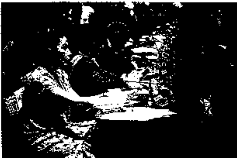
estimulantes de tipo anfetamínico

En su discurso, la senadora Itzel Ríos señaló que la trata de personas y el narcotráfico se presentan como problemas de mayúsculo impacto y uno de los mayores retos dentro del panorama internacional, pues las ganancias que reportan son uno de los principales alicientes para que algunos grupos delictivos, entre ellos organizaciones terroristas, se dediquen a dicha actividad o la faciliten.