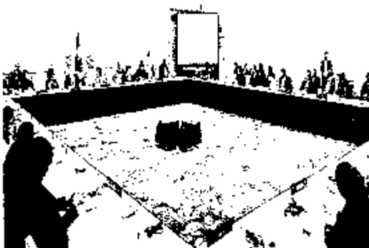
Antecedente: Reunión de Mujeres Parlamentarias en la 24ª Reunión Anual del Foro Parlamentario Asia Pacífico en Vancouver, Canadá, enero de 2016

La primera reunión de Mujeres Parlamentarias en el marco del Foro Parlamentario Asia Pacífico, tuvo lugar en Vancouver, Canadá el 17 de enero de 2016, a propuesta de las delegaciones de Indonesia y México, con el objetivo de ser congruentes con las resoluciones en materia de equidad y género y empoderamiento de la mujer que se habían estado aprobando en las distintas reuniones anuales del Foro Parlamentario Asia Pacífico.