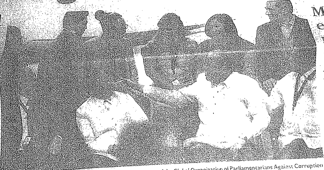
'GOOD LEADERS, GOOD LAWS, GOOD CITIZENS' is the theme of the Global Organization of Parliamentarians Against Corruption (Gopac) which is ongoing for the next two days at the Philippine International Convention Center in Manila. Delegates exchange pleasantries with President Aquino at the opening of the conference on Thursday. With the President are (from left) Senate President Juan Ponce Enrile, Vice President Jejomar Binay and Sen. Edgardo Angara, newly elected Gopac chair.