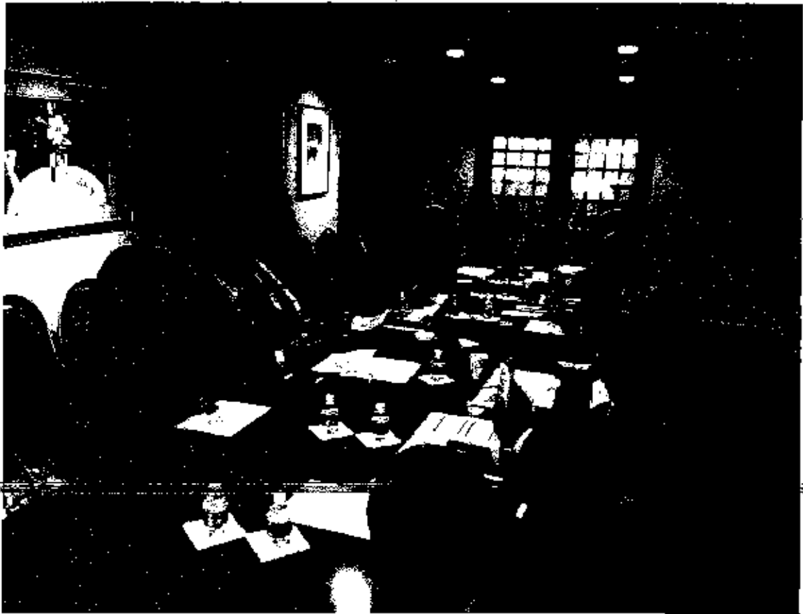
Diputados integrantes de la delegación con personal de la Embajada de México en Estados Unidos.

Uno de los datos más relevantes que se proporcionó, fue que se han presentado 46 iniciativas en el Congreso de Estados Unidos en el ámbito migratorio en lo que va de 2017, en las cuales las ciudades santuario y las visas son de gran relevancia. En este sentido, México podría aprovechar la coyuntura para retomar el tema de las visas de trabajo temporal.