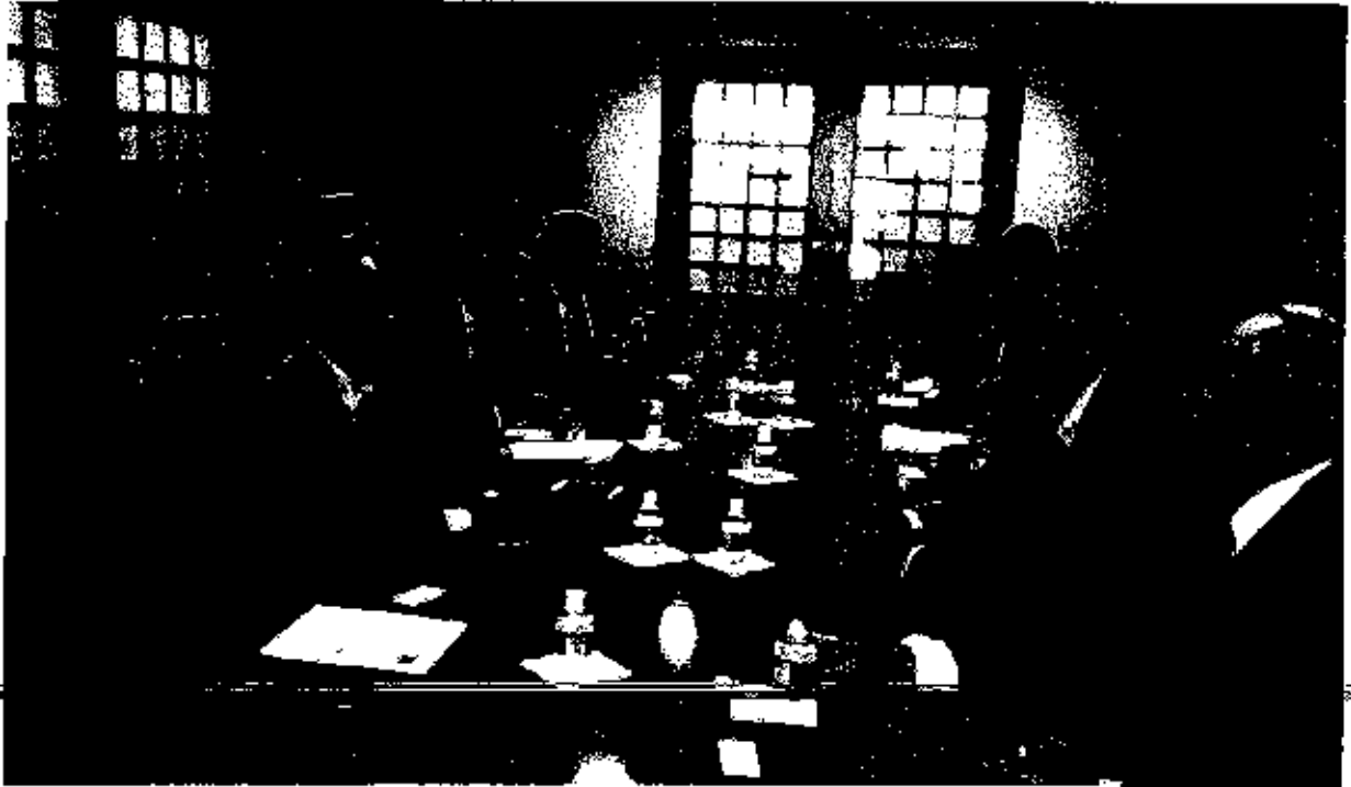
Integrantes de la delegación mexicana con los miembros del Consejo Exportador Lechero.

quien se mantuvo una plática a cerca de las oportunidades de crecimiento comercial que tiene la industria lechera.