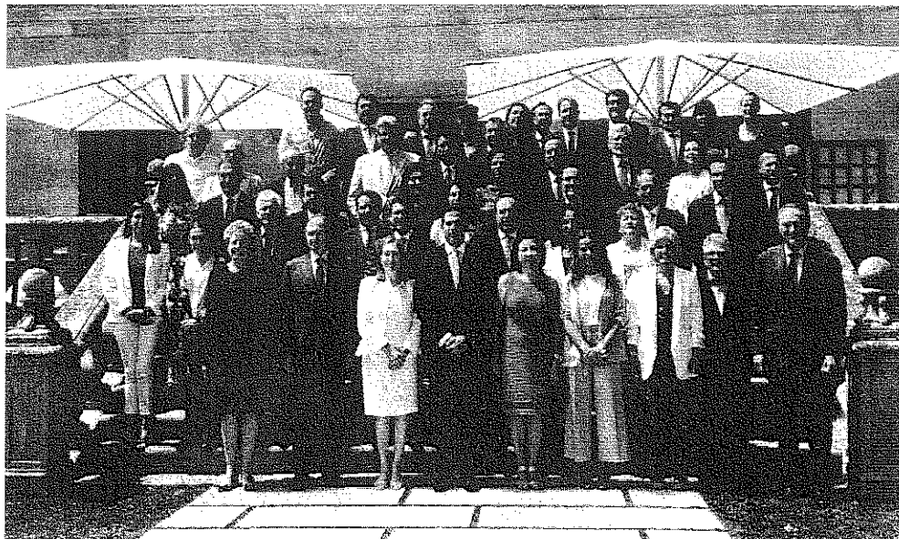
Delegación de congresistas de España en la parte izquierda y de la derecha parte de la delegación de México.

Asimismo, uno de los elementos más importantes a destacar es que instrumento ha dado lugar a importantes progresos en la integración de los sectores productivos de los dos países, y pone también de manifiesto que existe un gran potencial para seguir avanzando en distintos campos. Coincidieron “en que la modernización del Acuerdo es un asunto de alta prioridad para México y España”, y también reconocieron a España, y a la UE, como un socio comercial fundamental en el marco de los esfuerzos de México por diversificar su comercio exterior.