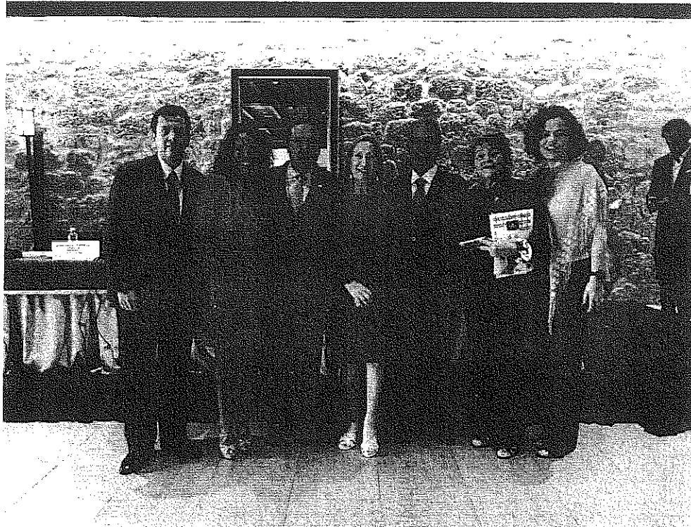
Fortaleciendo las relaciones España - México, en la XV Reunión Interparlamentaria.

Ambas delegaciones destacaron la importancia de los vínculos educativos y culturales en el desarrollo de las relaciones bilaterales. “La hermandad entre España y México descansa ante todo en sólidos lazos entre ambas sociedades, que existen gracias a una cultura común que debe seguir enriqueciéndose”, señalaron.