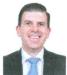
DIP. FRANCISCO RICARDO SHEFFIELD PADILLA PAN GUANAJUATO