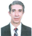
DIP. JOSÉ IGNACIO PICHARDO LECHUGA PRD VERACRUZ