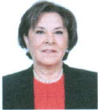
DIP. NOEMI ZOILA GUZMÁN LAGUNES PRD VERACRUZ